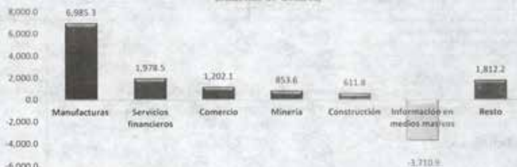
Distribución Sectorial de la IED enero-junio de 2014 (millones de dólares)

Los 9 mil 732.5 mdd fueron reportados por 2 mil 582 sociedades mexicanas con IED en su capital social, además de fideicomisos y personas morales extranjeras que realizan de forma habitual actividades comerciales en el país.